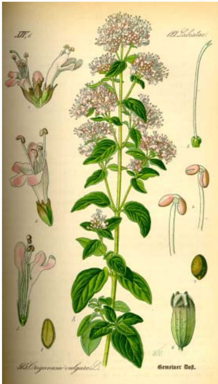
Lebiodka pospolita – Origanum vulgare L.

Roślina wieloletnia dorastająca do 80 cm wys.; kłocze poziomo rozrastające się; łodyga 4-kanciasta, czerwonawa; ulistnienie równoległe; liście jajowate, całobrzegie, od spodu ciemno nakrapiane (gruczoły z olejkiem); kwiaty zebrane w baldaszkowate kwiatostany (podbaldachy); kielich rurkowaty 5 ząbkowy; korona biała, różowa, fioletowa lub niebieskawa z 5 łatkami, dwuwargowa; pręcików 4; słupek 1; owoc - rozłupnia. Roślina w Polsce pospolita, zwłaszcza na pogórzu. Rośnie na łąkach, zboczach, w świetlistych lasach, na polanach, pastwiskach. Kwitnie od późnej wiosny do jesieni.